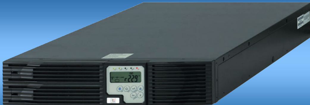
EA-UPS DSPMP 1106